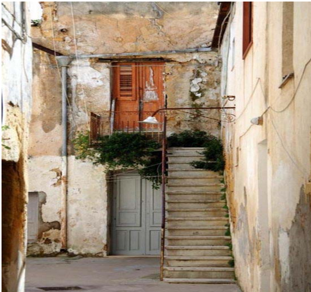
Die arabische Kasbah

Jenseits der Klischees: Lebenslust und Kultur westlich von Palermo.