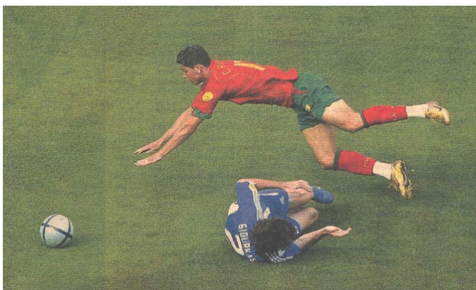
Zum Auftakt stolperte Portugal über Griechenland